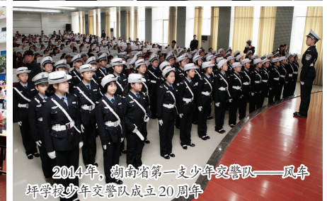
2014年，湖南省第一支少年交警队——风车坪学校少年交警队成立20周年