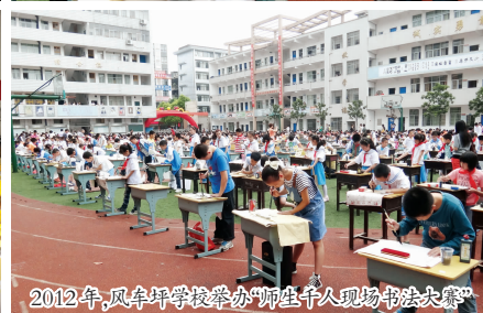
2012年，风车坪学校举办“师生千人现场书法大赛”