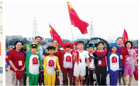
▲ 2008年，风车坪学校独轮车队参加“迎奥运火炬接力（湘潭站）”的启动仪式