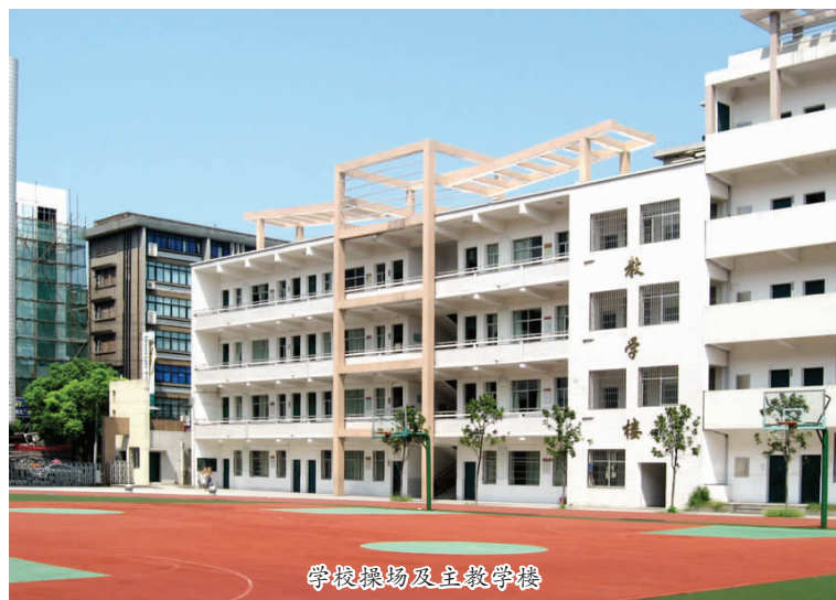
学校操场及主教学楼

4. 搭建广阔平台，打造名师团队。 学校坚持开展读书活动，提升教师人文素养；注重教学技能培训，坚持开展十项修炼等活动；组织参加各级培训学习。2012年度组织教师参加培训观摩学习200多人次，32位老师参加了市新课标学习培训，（下转封三）