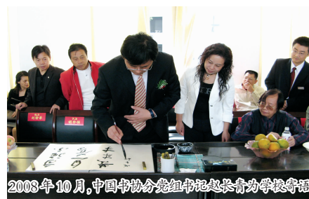
2008年10月，中国书协分党组书记、秘书长为我校题词