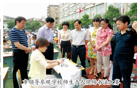
市领导参观学校师生千人现场书法大赛