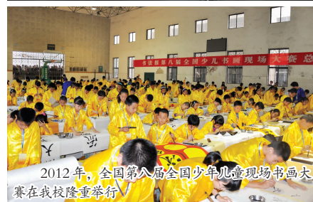
2012年，全国第八届全国少儿现场书画大赛在我校隆重举行